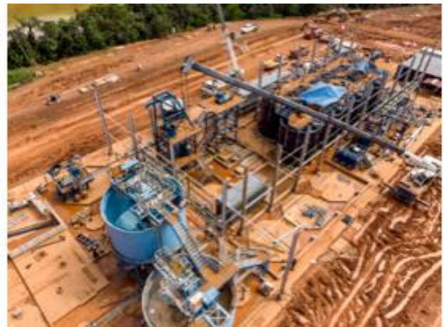
Usine de Dieu Merci - 17 août 2018

Sous l'impulsion de Brexia Gold Plata Peru (BGPP), afin de renforcer les équipes dans cette phase critique et dans une logique de consolidation et de standardisation des processus, du personnel spécialisé intègre progressivement les équipes d'Auplata pour accompagner la phase finale, et de nouveaux postes techniques sont créés.